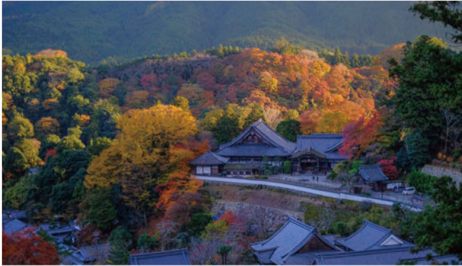
真言宗豊山派総本山長谷寺（紅葉の見頃：例年11月上旬～下旬）

いにしえびとも慈しんだであろう紅葉の絶景は、錦秋と称するにふさわしい美しさ。本堂の舞台は紅葉狩りにも絶好のビュースポットです。