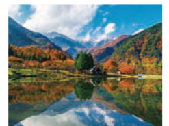
駒ヶ根高原・駒ヶ池